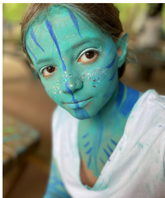
ART A FONTS